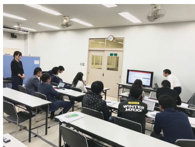
▲[セミナー] テレワークがどういうものかイメージしやすく説明