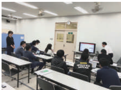
▲[セミナー] テレワークがどういうものかイメージしやすく説明